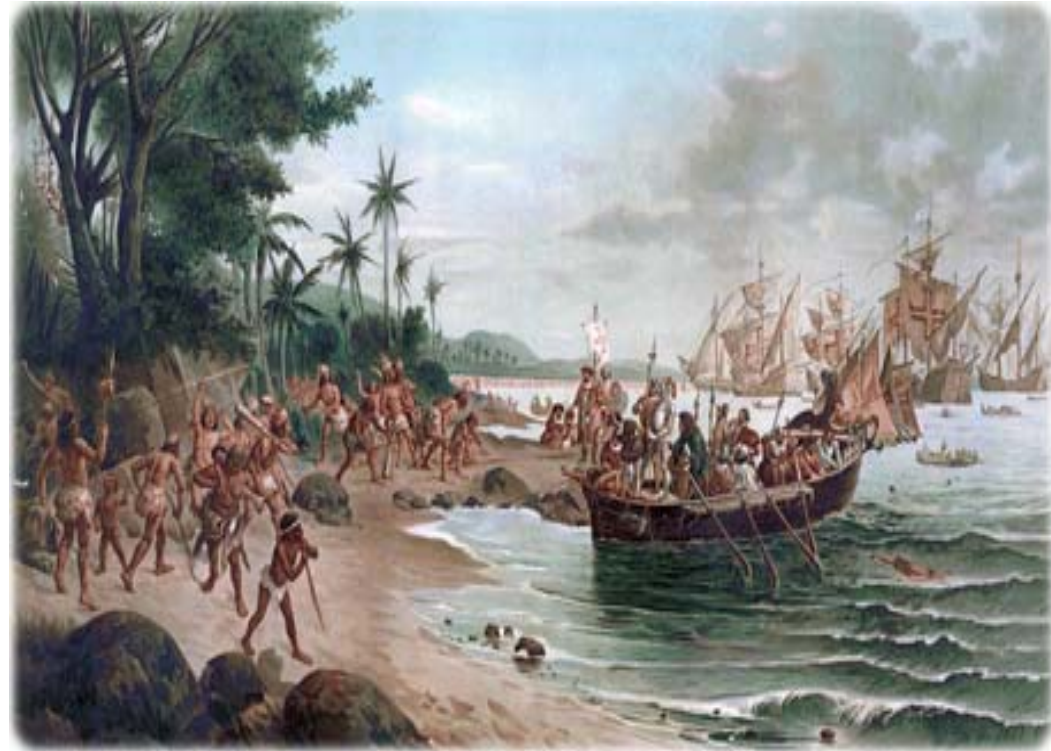
Llegada de Pedro Alvares Cabral a Terra da Vera Cruz (1500)