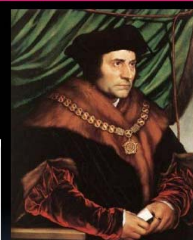
Thomas Morus- "Utopia"